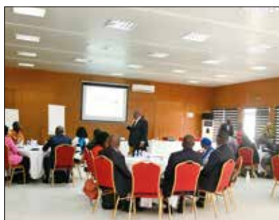
LE COMITÉ DE DIRECTION D'IVOSEP EN SÉMINAIRE SUR LA PERFORMANCE