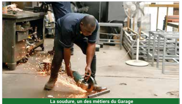
La soudure, un des métiers du Garage