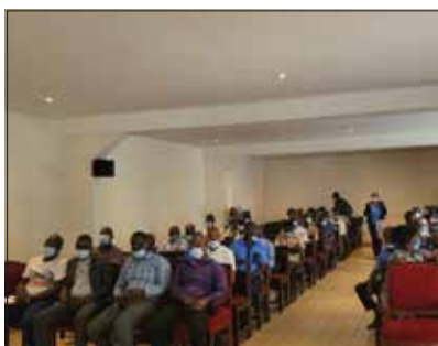
LA MUTIVO TIENT SA PREMIÈRE ASSEMBLÉE GÉNÉRALE DE L'AN 2022