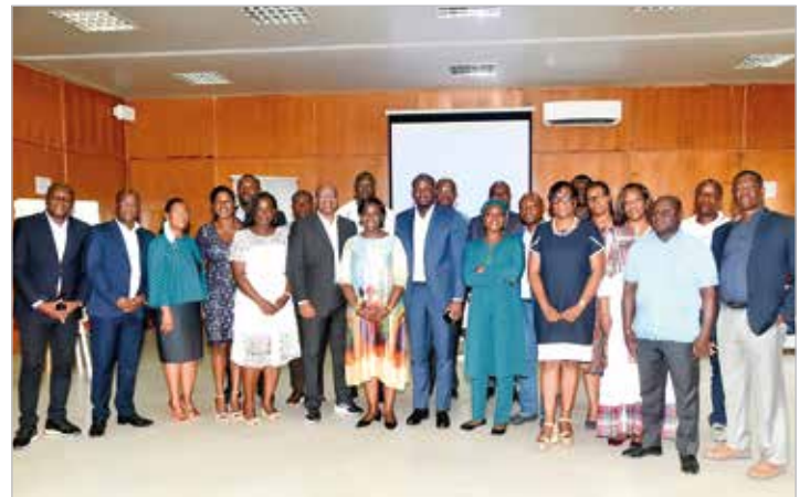
Le Comité de Direction d’IVOSEP s’est félicité de la tenue de ce séminaire

permis de comprendre ce qu’est réellement la performance, comment y parvenir moi-même, comment emmener mon équipe à partager la vision de l’entreprise et comment détecter les talents de mes collaborateurs », a-t-elle souligné.