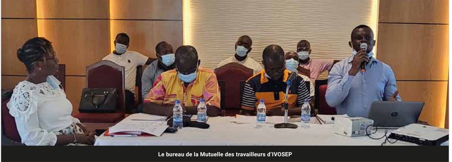
Le bureau de la Mutuelle des travailleurs d'IVOSEP

intérieur ainsi que le nouveau bureau composé d'un président, de deux vice-présidents, d'une secrétaire générale.