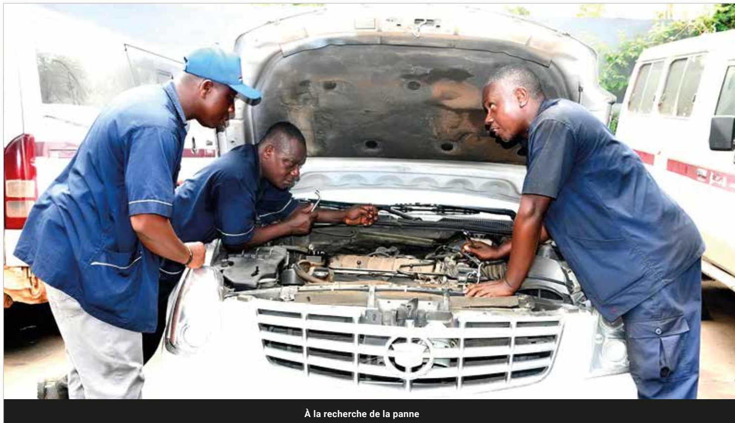
À la recherche de la panne

les 17 employés de ce garage travaillent d'arrache-pied pour maintenir en parfait état ou réparer les 156 véhicules que compte à ce jour IVOSEP : il s'agit de corbillards, de véhicules de fonction et de service.