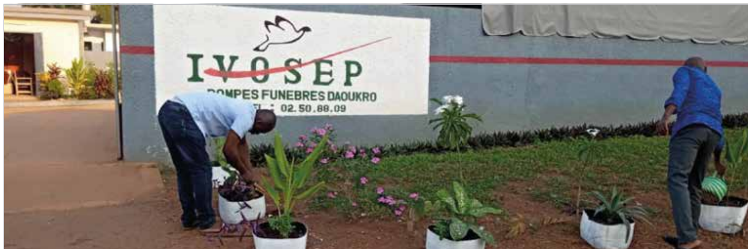
Les employés d'IVOSEP/Daoukro à la tâche pour l'embellissement de leur lieu de travail

Oui, Justine Djiragbou l'a compris : IVOSEP est aussi là pour reconforter les familles !