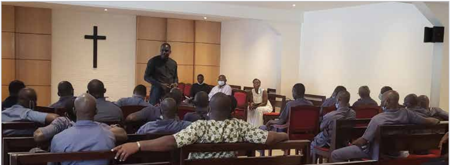
Entretien avec les chauffeurs d'IVOSEP sur l'importance du travail de qualité

Nous utilisons aussi la communication visuelle en passant par l'affichage de la politique qualité sur le site du siège d'IVOSEP. Une équipe de pilotage des processus (réfèrent qualité par processus ou service) a également été mise en place.