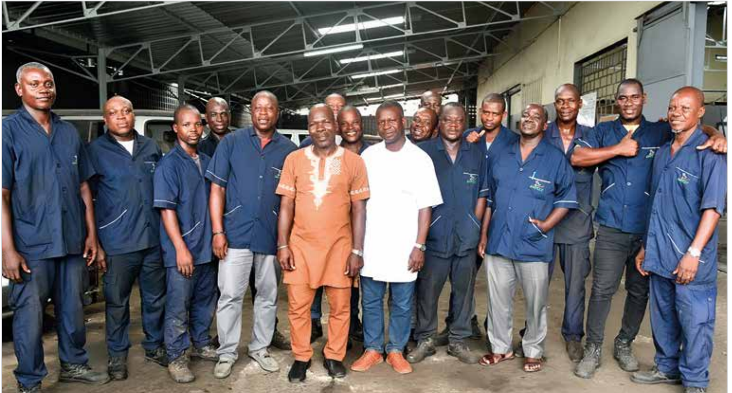
L'équipe dévouée du Garage d'IVOSEP

techniques ainsi que les paiements de l'assurance, de la patente, de la carte de stationnement, de la vignette, etc. « Je peux assurer haut et fort que nous faisons de la qualité au Garage », lance-t-il fièrement.