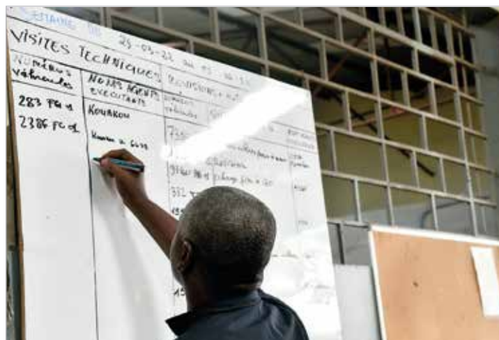
Le tableau d'affichage d'IVOSEP est régulièrement mis à jour

véhicule concerné est éloigné d'Abidjan, IVOSEP collabore avec les garages de la contrée pour une intervention en sous-traitance. S'il s'agit d'une panne grave qu'on ne peut réparer sur place, le véhicule est remorqué sur Abidjan pour une intervention adéquate.