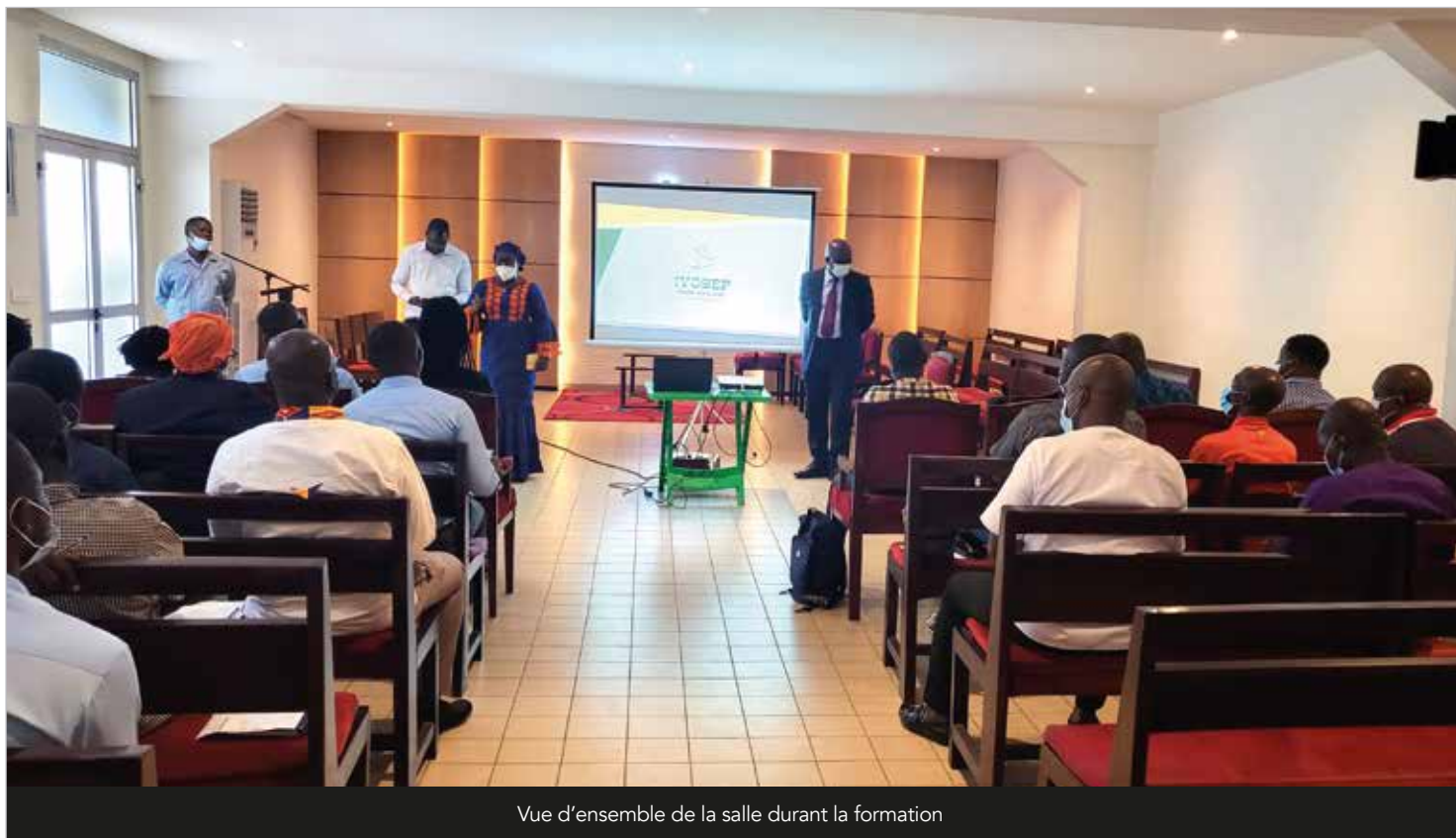
Vue d'ensemble de la salle durant la formation