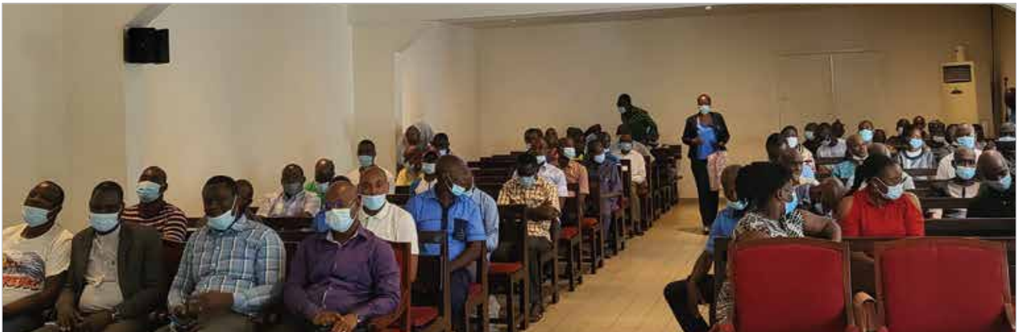
Les mutualistes à l'écoute de la MUTIVO

Dans une ambiance bon enfant, la réunion s'est achevée par une collation.